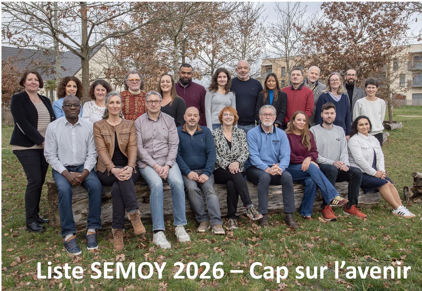
Liste SEMOY 2026 – Cap sur l'avenir